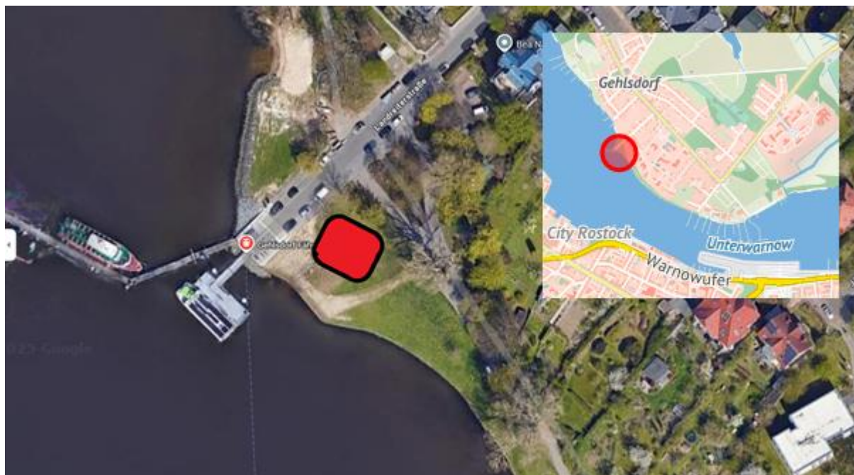
Abbildung 1: Zu vergebende Standfläche (rot markiert)

Ziel des Gesamtprojektes ist es, das Rostocker Oval (Stadthafen bis Fähranleger Gehlsdorf) für die Rostocker*innen und Besucher attraktiver und erlebbarer zu gestalten. Hierbei sollen einzelne Oasen geschaffen werden, welche die Besucher zum Verweilen einladen, jedoch gleichzeitig niederschwellige Angebote bieten und den Konsumzwang geringhalten. Dabei kann es sich sowohl um personell betriebene gastronomische Einheiten handeln, aber auch automatisierte Verkaufseinrichtungen sind willkommen und vorstellbar.